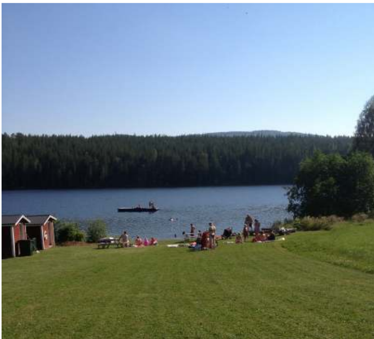
Havrabadet juli 2014. Soligt och varmt, 23 grader i vattnet, ingen trängsel och härlig natur.