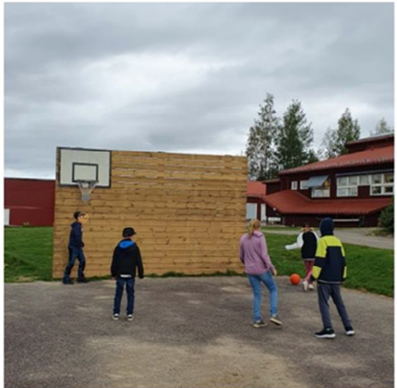
Skoj att spela vägg på nya bollplanket!