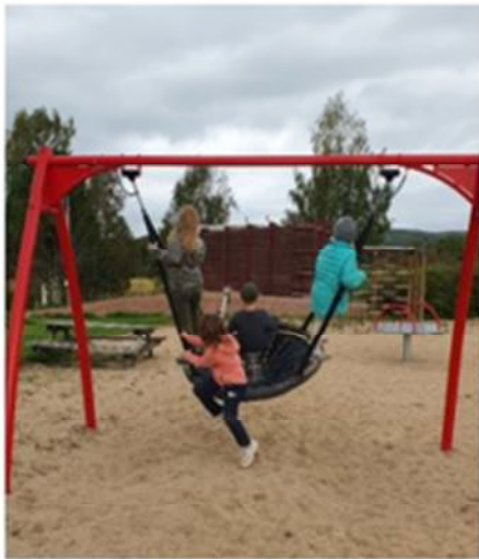
Det är roligt att gunga flera!