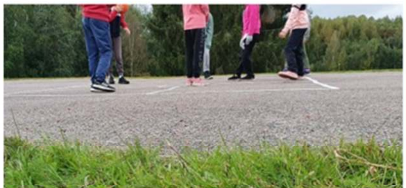
Kingrutan är populär