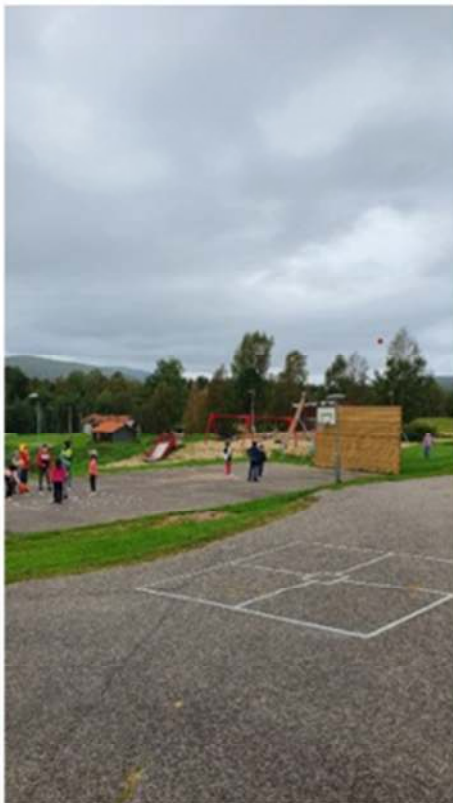
Alla leker och har skoj!