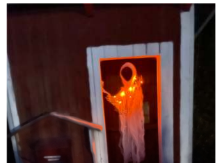
Här kommer en halloweenhälsning från Timanstorpet i Nyåker