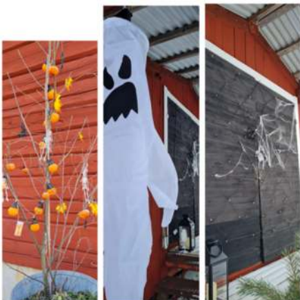
Lite läskigt i Brännås under några dagar.