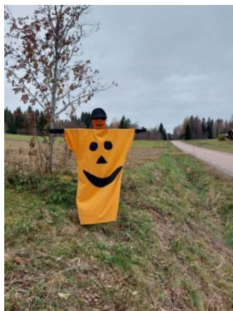
Mai's glada spöke hälsar välkommen till Holmberg