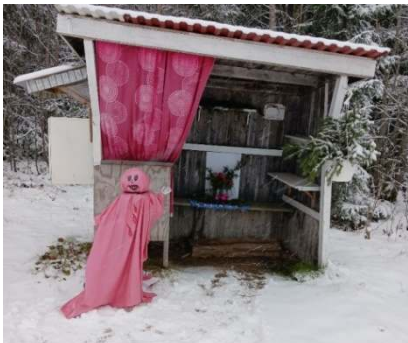
FinaLina installerad i Norrhavras byteskur