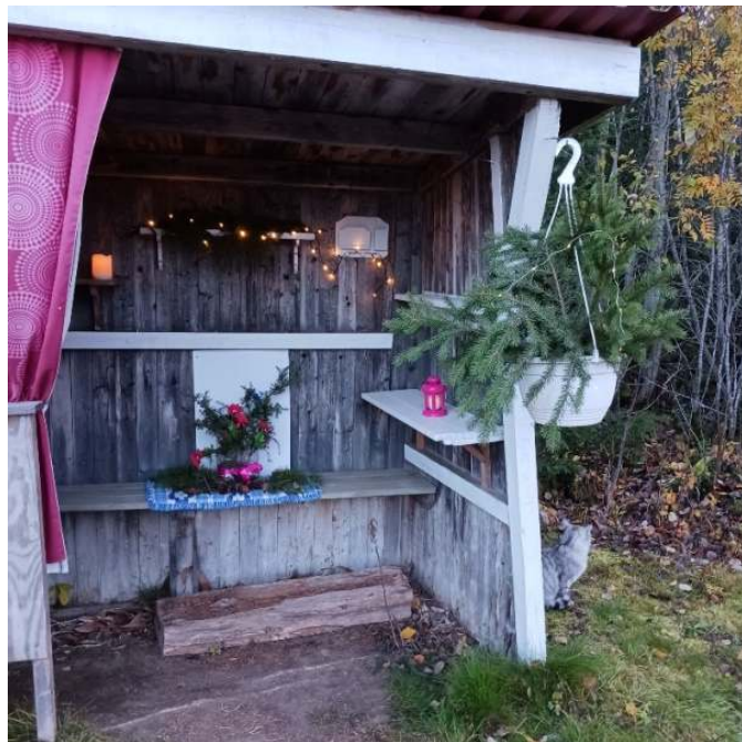
Fd busskur i Norrhavra

Kan sen skicka in alla bidrag till HT:s läsartext för att visa vad vi gör här i Dalen Välkommen med ditt bidrag!