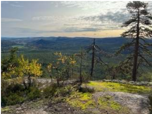
Vyer från Hornberget.