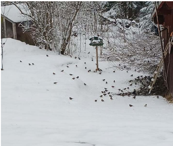
Småfåglarna är hungriga Text o foto Birgitta Nilsson